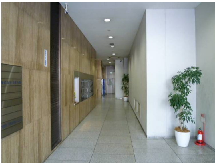
1階エントランス内部